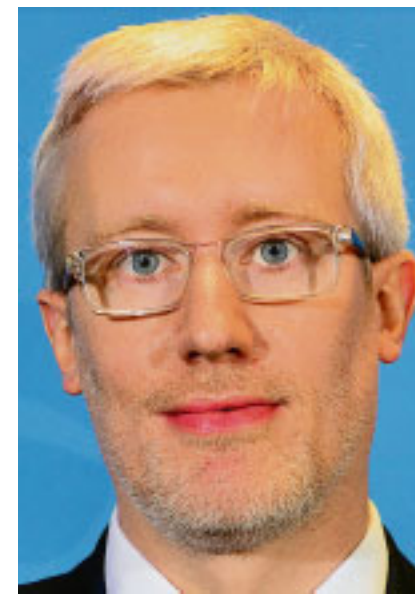
Benjamin-Immanuel HOFF

Die Erzdiözese München und Freising, die für die Pilotphase 651.000 Euro aufgewendet hat, wird das Projekt auch nach der Verlegung nach Rom unterstützen – mit 500.000 Euro in den nächsten fünf Jahren. Auch die Deutsche Bischofskonferenz will sich an der Weiterführung beteiligen. Für Kardinal Marx ist das Schwinden der öffentlichen Aufmerksamkeit für das Thema, das gegenwärtig zu beobachten ist, kein Grund zum Nachlassen in den Anstrengungen. Es müsse alles getan werden, um Kindern in der Kirche einen Ort zu geben, wo sie die Möglichkeiten frei entfalten könnten, die von Gott gegeben seien. Wenn der Kardinal über das Präventionsprogramm spricht, ist ihm anzumerken, wie sehr es ihm ein Herzensanliegen ist: Er empfinde tiefe Trauer und Scham über das, was Kindern und Jugendlichen im Raum der Kirche angetan worden sei.